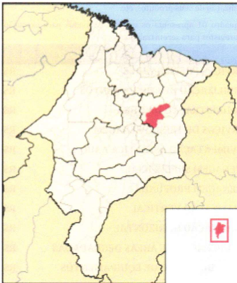
Figura 1 - Mapa de localização do município de Codó - MA